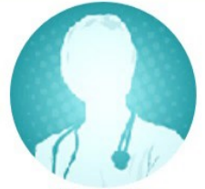
سرکار خانم دکتر